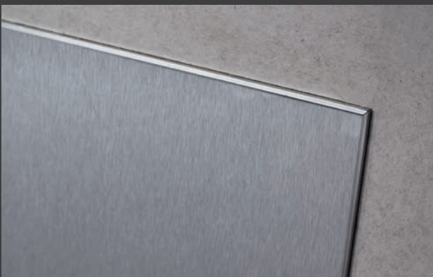
Oberfläche: Edelstahl geschliffen oder pulverbeschichtet

Schlagfeste Argumente sprechen bei der Metallbeschichtung für sich. Die Oberfläche aus geschliffenem oder pulverbeschichtetem Edelstahl ist durch sein stabiles Material gegen sämtliche äußere Einwirkungen hochbelastbar, makroskopisch glatt und somit zusammen mit Glas im System die robusteste Wandverkleidung.